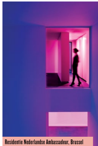
Residentie Nederlandse Ambassadeur, Brussel