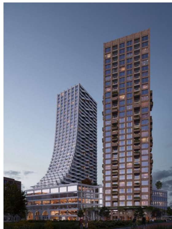
The Ensemble, Amsterdam. Ontwerp: Van Belle & Medina – CONIX RDBM Architects

we dat doen, in welke vorm, hoe zorgen we ervoor dat het flexibel is en hoe vinden we draagvlak in de organisatie? Dat alles gaat vooraf aan het eigenlijke architectenwerk, waardoor onze ontwerpprocessen veel beter voorbereid zijn.'