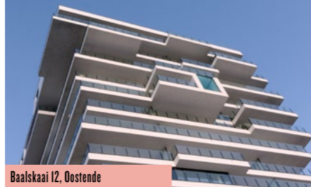
Baalskaai 12, Oostende